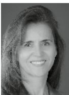
Cornelia Sengpiel Cambios GmbH