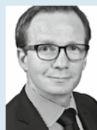
Etienne Kneschke KARL STORZ SE & Co. KG