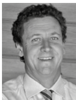
Bernd Heesen Internationale Führungsakademie Berchtesgadener Land GmbH & Co. KG

Dieser Referent wird von Teilnehmern früherer Veranstaltungen mit „sehr gut“ bewertet.