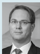
René Kuhr MHP Management- und IT-Beratung GmbH